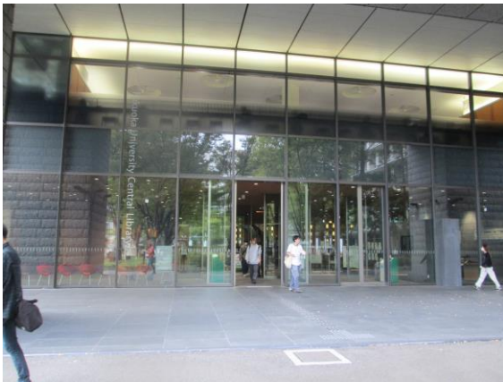
中央図書館玄関へ