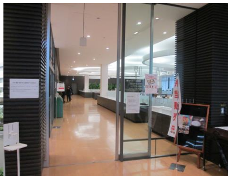
図書館玄関に向かって右手のセブンイレブン(当日は休業)の横に懇親会場「陽だまり」があります(大会当日は休憩所にもお使い下さい)