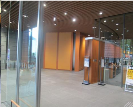
玄関から左手が大会会場